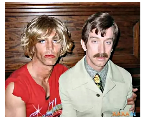
• Типичная европейская семья «государственных родителей»

В качестве альтернативного пути обществу навязывают т.н. «православную культуру» . Другими словами, стратеги мировой закулисы решили: если славян не удастся загнать в европейское рабство, то им будет обеспечено рабство старое — с византийским душком.